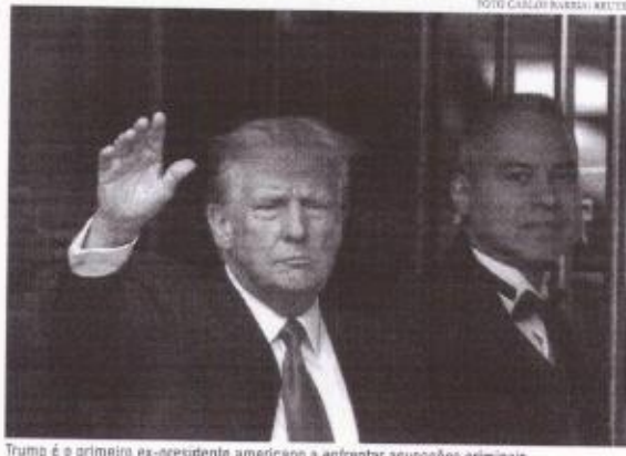
Trump é o primeiro ex-presidente americano a enfrentar acusações criminais

Até o momento, a acusação do grande júri ainda não foi aberta e detalhes sobre quais são as acusações enfrentadas pelo ex-presidente seguem desconhecidas. No entanto, Trump chegou ao escritório do procurador distrital por volta das 14h25, no horário de Brasília, e deixou o local cerca de duas horas depois diretamente para o aeroporto, onde embarcou com destino à Florida. Agora, ele e oficialmente o primeiro ex-chefe de Estado norte-americano a