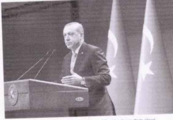
Recep Tayyip Erdoğan anunciou sua vitória, neste domingo (28), antes do resultado oficial

O presidente turco somará, com isso, 25 anos no comando do país e deve continuar no cargo até 2028. Ele derrotou o adversário Kemal Kilicdaroglu