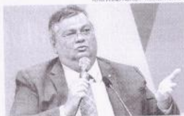
O ministro da Justiça esteve nesta terça (9) em audiência na Comissão de Segurança Pública

"Senador Moro, eu vim aqui como ministro e senador para ser respeitado. Se um senador acha que pode cercar minha palavra, se um senador diz que eu tenho que ser preso, isto é resposta? Pense bem, pensa com a sua consciência", disse. "Eu sou uma pessoa honesta, ôhela limpa, fui juiz juiz. Nunca fiz contato com o Ministério Público. Nunca tive uma ventura suada. E por ser todo um meu homem, governador honesto, que eu não admito que alguém venha de-