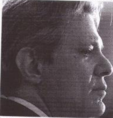
O ministro comparou as regras propostas com o regime de metas de inflação, estabelecido pelo Conselho Monetário Nacional (CMN).