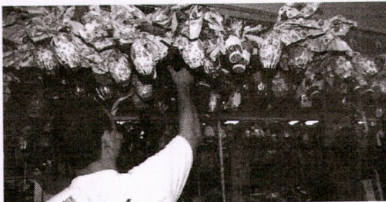
21% das famílias com renda de até um salário mínimo já garantiram chocolates

Curiosamente, 43% dos brasileiros afirmam jamais ter comprado sequer um ovo de Páscoa, contrastando com os 37% que mantêm o hábito todos os anos. O perfil do consumidor mais fiel inclui moradores da região Sudeste, com idades entre 35 e 40 anos, renda familiar superior a cinco salários mínimos e filhos menores de 18 anos. O levantamento indica que o pico das compras deve ocorrer até o domingo de Páscoa (20 de abril), com 34% dos consumidores ainda planejando suas aquisições, enquanto apenas 18% já foram às lojas. Outro dado curioso é que 21% das famílias com renda de até um salário mínimo já garantiram seus chocolates, enquanto 45% dos lares com rendas mais altas ainda não compraram. A pesquisa ouviu duas mil pessoas em todo o Brasil e aponta que, mesmo