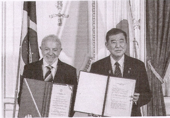
A negociação para exportar a carne bovina ao Japão vem sendo conduzido há mais de 20 anos

O primeiro-ministro do Japão, Shigeru Ishiba, propôs ações para acelerar a abertura do mercado japonês à carne bovina brasileira. A demanda histórica dos produtores do Brasil foi um dos temas do encontro entre Ishiba e o presidente Lula (PT), que está em visita de Estado a Tóquio. O premiê sugeriu a formação de um grupo para o acompanhamento do setor e manifestou a disposição de enviar especialistas sanitários para coletar informações e avançar mais rapidamente para as próximas etapas de abertura. Um dos objetivos da viagem de Lula era, de fato, conseguir o compromisso político do Japão de enviar uma missão técnica para inspecionar as condições da produção de carne bovina do país. O Japão importa cerca de 70% da carne bovina que consome, o que representa aproximadamente US$ 4 bilhões ao ano. Desde 2010, 80% são importados dos Estados Unidos e da Austrália, históricos aliados do país. No caso do Brasil, o processo de negociação para exportar a carne bovina ao Japão vem sendo conduzido há mais de 20 anos. O último protocolo já está sendo debatido há cinco anos. Em maio de 2024, o Brasil se tornou livre de febre aftosa sem vacinação animal. O status abre caminho para que o Brasil possa exportar carne bovina para países como o Japão e a Coreia do Sul, que compram apenas de mercados livres da doença sem vacinação. Por outro lado, o fim da vacinação exigirá protocolos