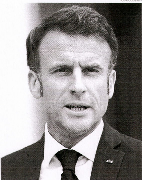
A reunião com Macron aconteceu em um momento delicado para as relações transatlânticas

A reunião acontecerá em um momento particularmente delicado para as relações transatlânticas.