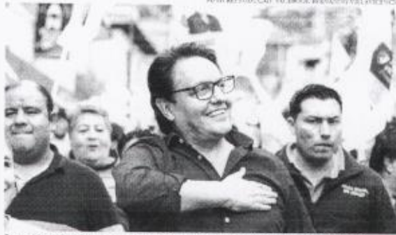
O presidencialista foi morto a tiros em Quito enquanto deixava um encontro político

De acordo com as investigações, o suspeito em questão foi visto nas imagens fazendo do local do crime e estava acompanhado do homem que morreu em uma troca de tiros com a polícia minutos após atacar contra o presidencialista e mata-líder. Entre as armas encontradas no local, havia um fuzil, uma metralhadora, quatro