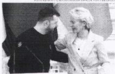
Ursula von der Leyen, presidente da Comissão Europeia, durante uma reunião em Bruxelas.

Em sua fala, o presidente brasileiro também voltou a comentar sobre o conflito no Oriente Médio e criticou novamente o governo de Benjamin Netanyahu pelas ações que estão sendo realizadas na Faixa de Gaza, reforçando que se trata de um "genocídio". Em meio às polêmicas envolvendo suas recentes falas sobre o tema, Lula disse não ser possível que o mundo gaste anualmente 2,2 trilhões de dólares em armas. "Guerras provocam destruição, sofrimento e mortes, sobretudo de civis inocentes", pontuou.