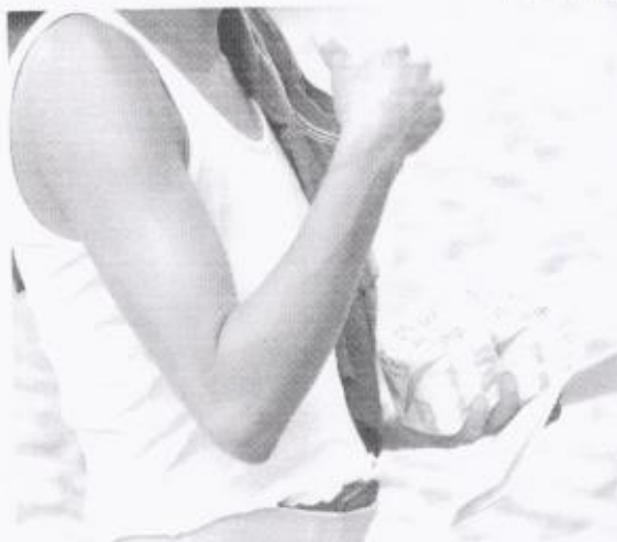
A nova medida deverá beneficiar cerca de 225 pessoas que menstruam em Fortaleza