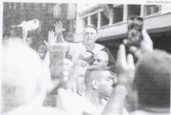
Fevereiro em defesa de Bolsonaro ocorreu em meio às investigações da PF sobre trama de golpe de Estado

Malafaia também fez uma crítica à presidente do STF, Cármen Lúcia. "Ela é uma mulher que não sabe o que é o Brasil", afirmou Malafaia, que também falou sobre o julgamento de Bolsonaro em 2022 e os ataques contra o presidente Lula. "É um ataque de 4 de janeiro de 2023, organizado por Bolsonaro. Não vou aqui falar o que é o Brasil, mas vou falar o que é o Brasil de hoje", afirmou Malafaia.