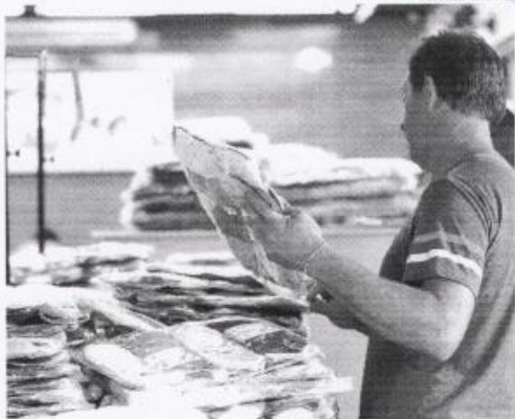
Atuamente existem cerca de seis milhões de MEIs com dívidas junto ao próprio governo

"A pessoa pegou o recurso a 4%, 5%, mais uma Selic [taxa básica de juros] que era de 18%, 3%. E a Selic aumentou para 13% em oito meses. Então, esse é o principal componente. Tem 7% ou 8% de pessoas que pegaram Pro-