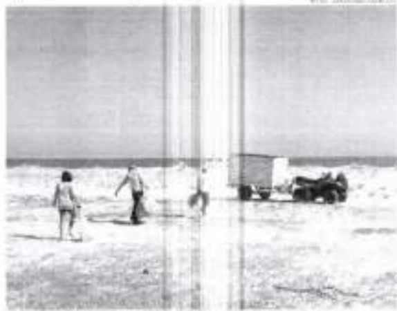
Em um ano, 18 toneladas de material reciclável foram recolhidas na região

Inicialmente, o projeto foi desenvolvido em uma pequena área da praia, mas hoje já se estende para o distrito de Baixo. Por meio desse projeto, conseguiu-se criar um ambiente favorável para a realização de eventos locais, como o projeto de lei.