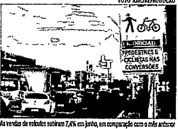
As vendas de veículos subiram 74% em junho, em comparação com o mês anterior

No início de junho, foi publicada no Diário Oficial da União (DOU) a Medida Provisória que criou o programa do Governo Federal que objetivava baratear os preços dos carros populares em todo o território nacional. A previsão era de que veículos comerciais leves poderiam ter descontos variando entre R$ 2 mil e R$ 8 mil. Além de movimentar a indústria automotiva do país, o programa também trouxe novas expectativas para setores relacionados. No Ceará, o Sindicato das Autoescolas (Sindicaf), por exemplo, prevê que a quantidade de alunos procurando dar início ao processo de habilitação aumentará em 10% nesse contexto, principalmente na categoria B, que possibilita a condução de veículos automotores de quatro rodas.