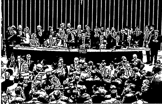
A casa faz esforço concentrado para votar a reforma tributária, carro-chefe das tramitações

Direitos sociais Várias proposições com direitos sociais foram também aprovadas, como a que muda os estatutos da Pessoa Idosa e da Pessoa com Deficiência (PL 4438/21) para incluir medidas protetivas a serem decretadas pelo juiz no caso de violência ou da ameaça de violência. Essas medidas são semelhantes às constantes da Lei Maria da Penha. Para pessoas com deficiência permanente ou Transtorno do Espectro Autista (TEA), o Plenário aprovou