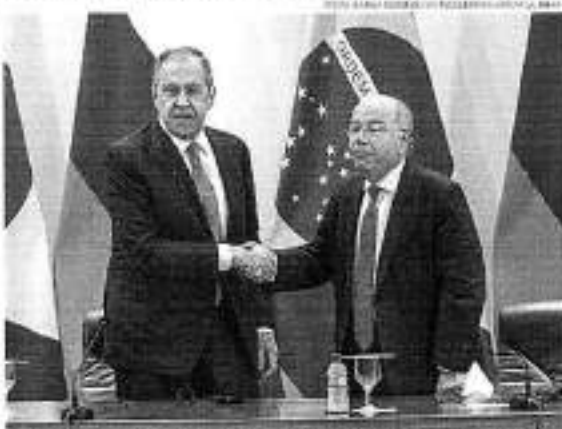
Mauro Vieira e o ministro das Relações Exteriores russo se cumprimentam após uma reunião bilateral no Itamaraty.

Deputado. O ministro de Relações Exteriores russo, Sergei Lavrov, se encontrou com o ministro de Defesa, Mauro Vieira, no Palácio do Itamaraty, durante o encontro. Lavrov agradeceu o acolhimento do Brasil ao visitar a Ucrânia, que está em guerra desde fevereiro de 2022. De acordo com o comunicado, os dois ministros se reuniram em uma reunião bilateral para discutir a situação da Ucrânia e o papel do Brasil no conflito.