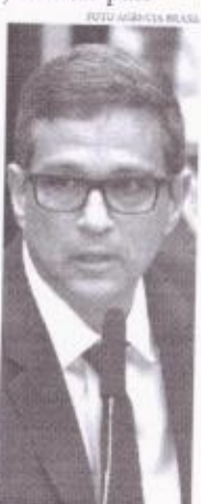
Após uma tregua, o petista voltou às críticas contra a alta taxa de juros e a autonomia da instituição

apertam fúrias nas críticas à taxa básica de juros, considerada "excessiva" por petistas, e argumentam que foram as decisões do presidente contra a autonomia do Banco Central e a favor de mais gasto público que fizeram subir as expectativas de inflação, tamanho mais difícil a queda de taxa Selic. Nesta semana, no entanto, o petista havia evitado criticar a taxa de juros, a instituição e Campos Neto, indicando que estaria seguindo os conselhos dos aliados para evitar o confronto. O presidente do Banco Central também deu declarações conciliatórias. No programa Roda Viva (TV Cultura), que foi ao ar na segunda-feira (13), Roberto Campos Neto mostrou disposição com o governo e disse que fez tudo o que estava ao alcance para aproximar o BC da gestão petista. Dois dias depois, na quarta-feira (15), durante sessão no Congresso Nacional, declarou que é preciso ter um "olho mais especial no social".