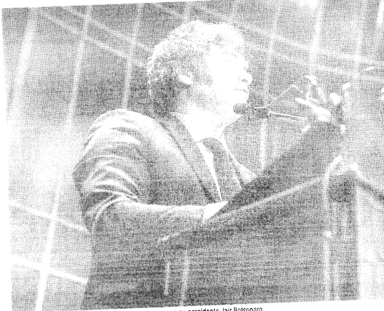
Em solo brasileiro, Javier Milei deve se encontrar com o ex-presidente Jair Bolsonaro

O presidente argentino está prestes a embarcar para o Brasil e reforçou que o petista interferiu na campanha eleitoral de seu país no ano passado