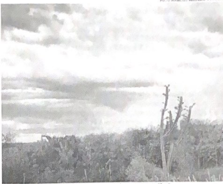
"Nesta quarta-feira, o Ceará pode ter chuvas em todas as macrorregiões"

A Fundação Cearense de Meteorologia e Recursos Hídricos (Funceme) explica que o Ceará encontra-se no período da pré-estação chuvosa, que teve início ainda em dezembro. A média para o período de dois meses é de 130,3 milímetros.