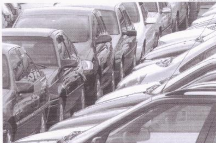
Para viabilizar o programa, o governo vai investir R$ 1,5 bilhão, sendo R$ 500 milhões automóveis populares

Quanto menor for o preço do veículo, maior deverá ser o desconto. Para bancar os custos, foi anunciada a retomada parcial da tributação sobre o diesel