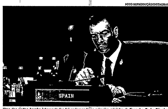
Uma das cartas-bomba interceptadas foi endereçada ao primeiro-ministro da Espanha, Pedro Sánchez

Nesta quinta-feira, 01, a Espanha divulgou que o gabinete do primeiro-ministro, a sede do Ministério da Defesa do país, uma fábrica de armas espanhola, a base aérea de Torrejón de Ardoz, em Madrid, e a embaixada dos Estados Unidos receberam cartas-bomba. Ao todo, especialistas já desarmaram 5 equipamentos explosivos que foram enviados a integrantes do alto escalão.