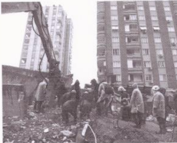
A Organização Mundial da Saúde estima que o terremoto pode afetar até 23 milhões de pessoas

Nesse contexto, o presidente turco prometeu que o governo enviará mais de 50 mil trabalhadores humanitários para a região e vai liberar 100 bilhões de liras, que equivalem a 5,3 bilhões de dólares, para prestar auxílio financeiro devido à tragédia. É importante destacar também que, além das dificuldades causadas pelos terremotos, o trabalho das equipes de resgate também está sendo afetado pelo inverno rigoroso no país, que chegou a gerar o impedimento do fluxo em algumas estradas. Erdogan, às vésperas de uma nova eleição, que ocorrerá em maio, está sendo duramente criticado nas redes