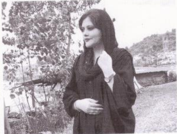
Mahsa Amini morreu sob custódia da polícia da moralidade do Irã

Nesta quinta-feira, 08, o Irã realizou a primeira execução relacionada aos protestos que estão acontecendo no país desde que a revolta de 22 anos. Mahsa Amini, morta sob custódia da polícia da moralidade do país após ser detida por supostamente não estar utilizando o véu islâmico obrigatório.