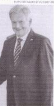
O presidente da Finlândia e o chefe do Executivo do Brasil concordam que a invasão russa foi ilegal

Nesta quinta-feira, 01, Luiz Inácio Lula da Silva recebeu, no Palácio do Itamaraty, em Brasília, o presidente da Finlândia, Sauli Niinistö. O europeu chegou ao Brasil na última quarta-feira, 31, e deve cumprir agenda em São Paulo hoje, 02, com foco na promoção comercial e de investimentos. Em entrevista concedida após o encontro, o chefe do Executivo brasileiro ressaltou que há espaço para cooperação entre ambas as nações em áreas como ciência, tecnologia e inovação. "A Rede de Inovação Brasil-Finlândia reúne pesquisadores e especialistas e fortalece vínculos entre a pesquisa básica e aplicada dos dois países. Mantém colaboração em áreas como comunicações, segurança cibernética, tecnologia militar e transição ecológica certamente trará benefícios concretos. Queremos reinarar o dinamismo do relacionamento, inclusive utilizando os canais brasileiros na Finlândia, em áreas como 3G e 6G e bioeconomia", garantiu Lula. Além disso, o líder brasileiro comentou sobre parcerias no setor de biocombustíveis, serviços aéreos e combate às mudanças climáticas. "Esta seria de que a delegação empresarial que acompanha o presidente Niinistö encontrará excelentes oportunidades de negócios