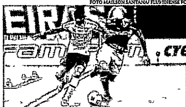
Com o resultado, o Palmeiras ampliou a sua vantagem na liderança

Em um jogo no qual teve certa dificuldade para criar boas jogadas, o Palmeiras contou com um gol contra para vencer o Fluminense por 1 a 0, na noite de sábado (24), no Allianz Parque. Foi o bastante para os palmeirenses manterem a invencibilidade contra o rival em sua arena, onde o time carioca nunca conseguiu ganhar. Agora, são oito duelos desde a inauguração do estádio, em 2014, com 100% de aproveitamento dos mandantes. Assim, a equipe alviverde ampliou sua vantagem na liderança do Campeonato Brasileiro. Chegou aos 31 pontos, contra 25 do Atlético-MG, o segundo colocado. A equipe mineira vai encerrar o Bahia neste domingo (25), em Belo Horizonte. O único gol da partida saiu aos