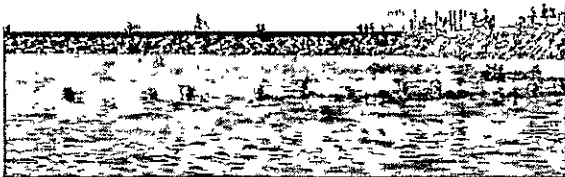
Com o decreto, atletas que faziam uso dos clubes se viram na obrigação de praticar as atividades nos mares